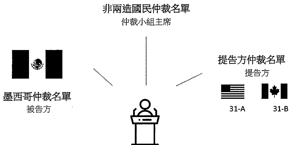
圖表 3. 快速回應勞工仲裁小組之成員

D 前述挑選成員係透過抽籤方式進行，而每一仲裁小組將由提告方（加拿大或美國）仲裁名單選出 1 名成員，另 1 名成員則從被告方(墨西哥)仲裁名單選出，第 3 名成員則由非兩造國民仲裁名單選出，並擔任該仲裁小組主席一職。